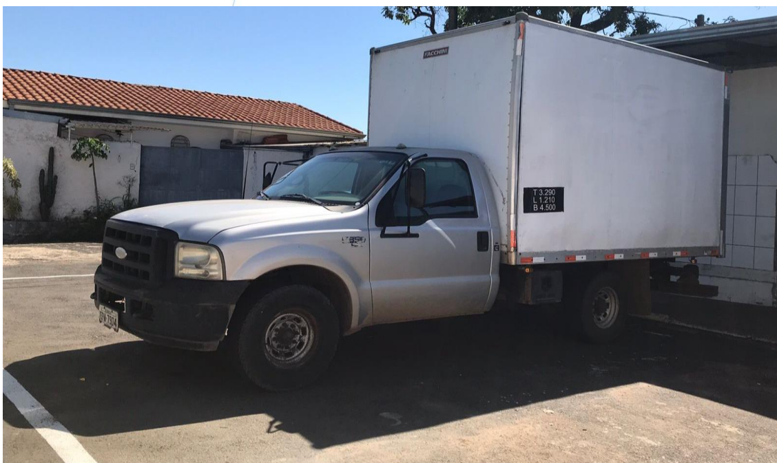
Foto 024: Frota de Veículos da Recuperanda que encontrava-se no local no momento da vistoria (2)