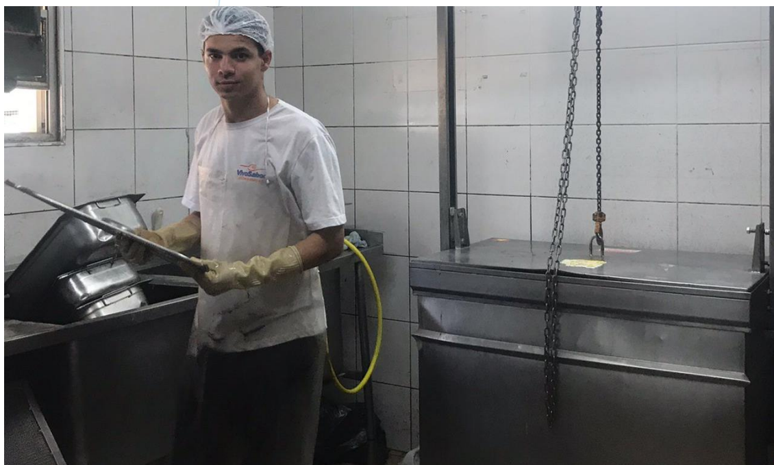
Foto 014: Colaborador trabalhando no setor de lavagem de utensílios