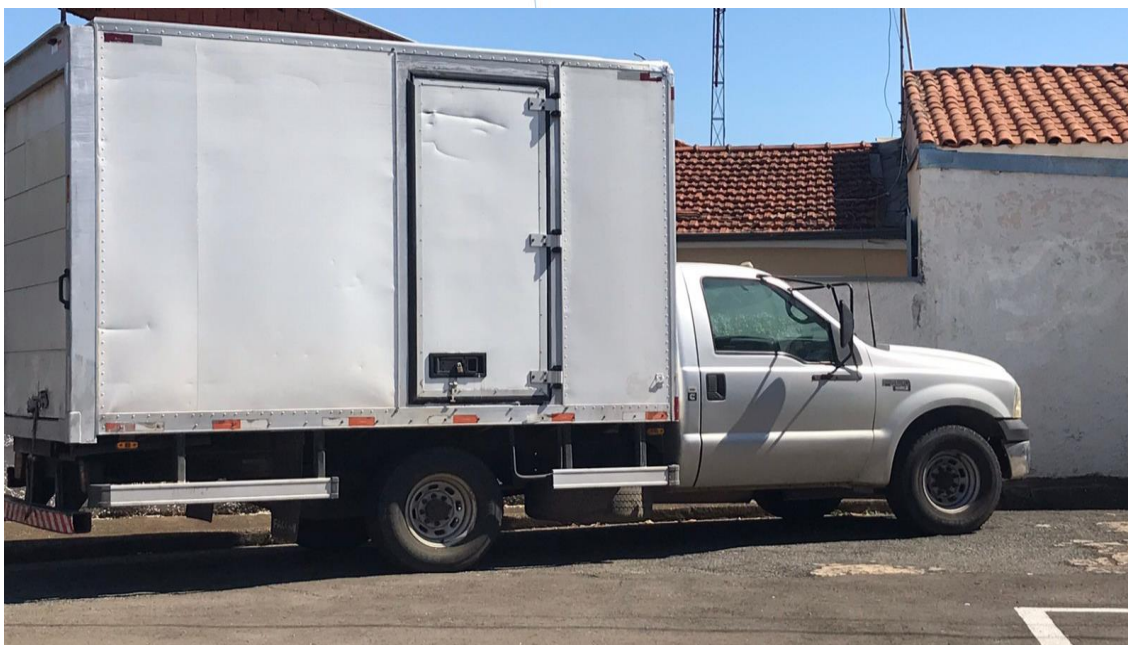
Foto 023: Frota de Veículos da Recuperanda que encontrava-se no local no momento da vistoria (1)