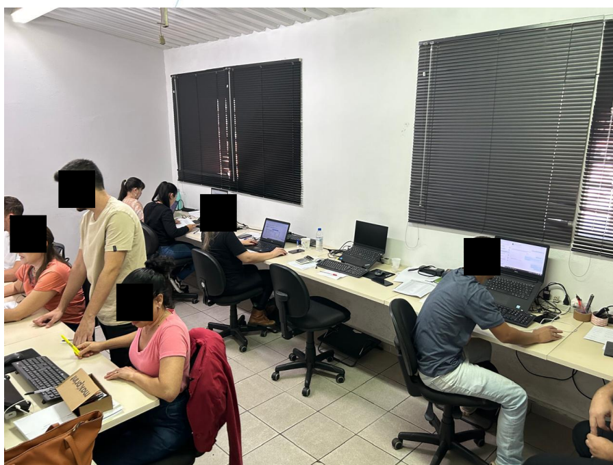
06 – Colaboradores Trabalhando