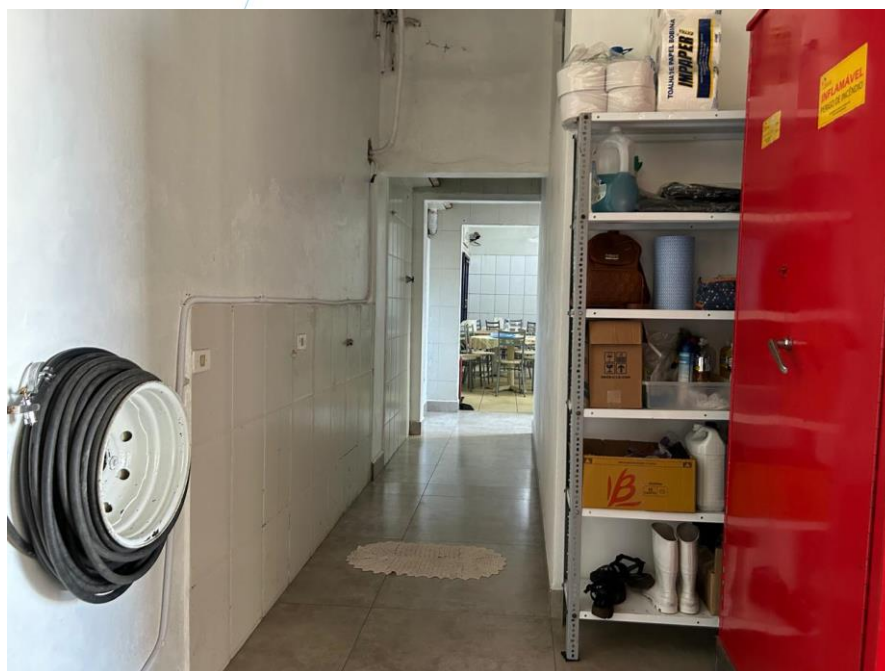
02 – Corredor