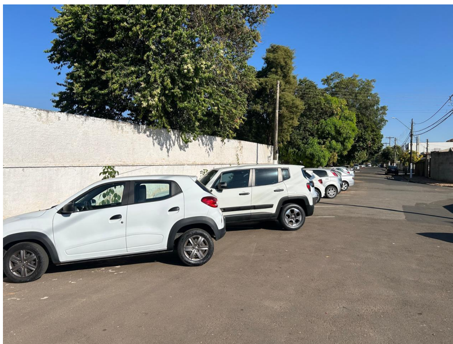
04 – Veículos Colaboradores