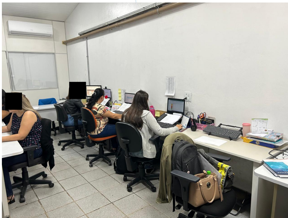
07 – Colaboradores Trabalhando

Conclusão: A operação se encontra ativa, com ambiente limpo, organizado e propício ao desenvolvimento das atividades empresariais