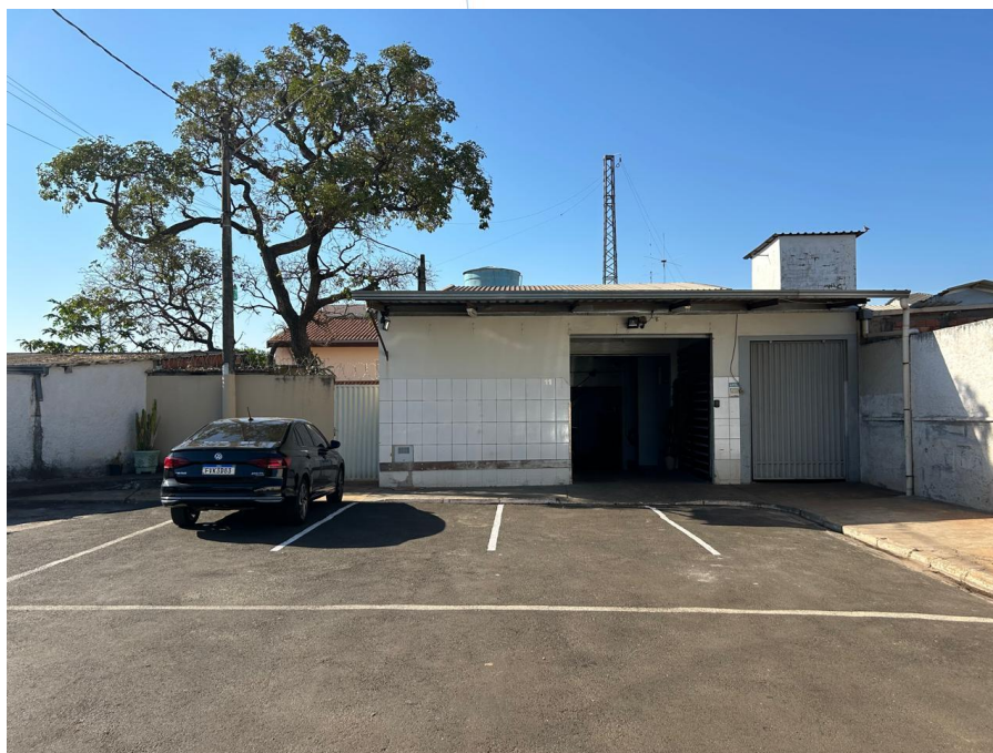
01 - Entrada