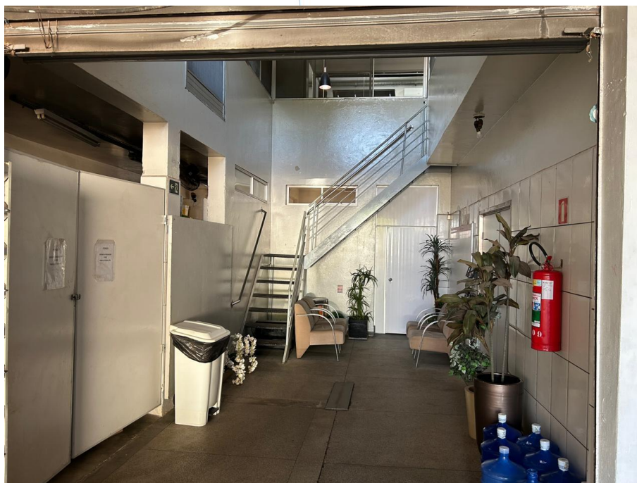
03 – Vista Paronâmica