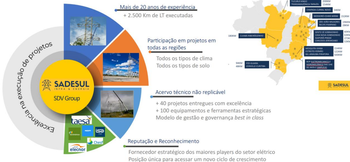
Fonte: Planejamento Estratégico SADESUL

O quadro abaixo ilustra as principais competências da Recuperanda, comprovando a sua vasta experiência e capacidade operacional.