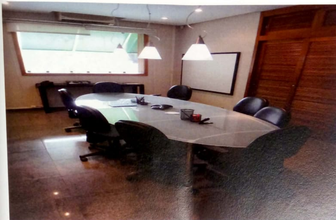
SALA DE REUNIÃO E DEPENDÊNCIAS DA EMPRESA