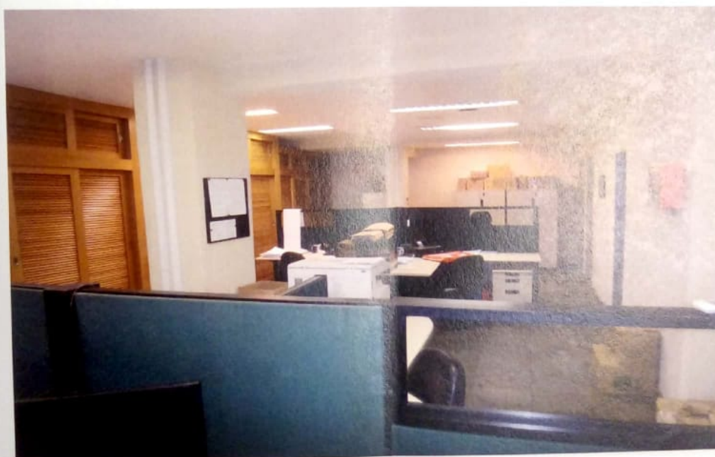
Relatório Mensal das Atividades – Set/2013