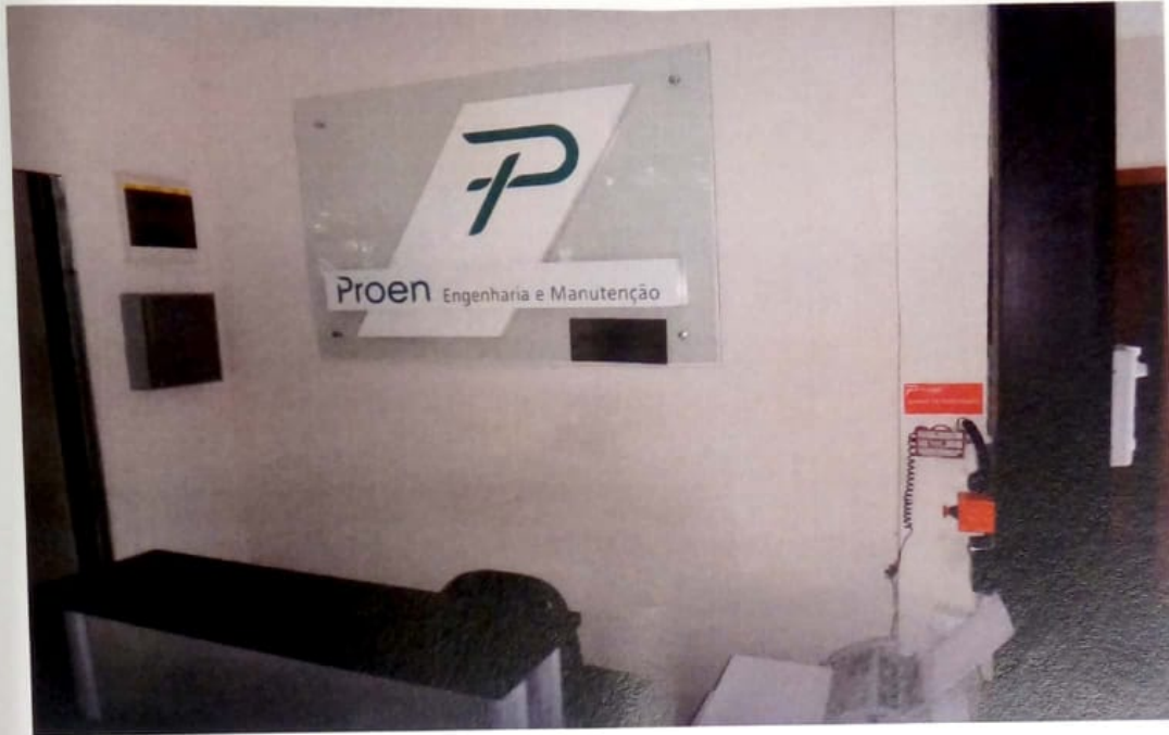
FOTOS DA RECEPÇÃO DA EMPRESA