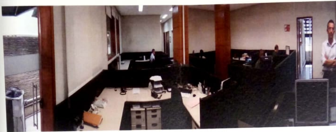
FOTO PANORÂMICA DO 2º ANDAR COM OS EMPREGADOS EM ATIVIDADE

Relatório Mensal das Atividades – Set/201