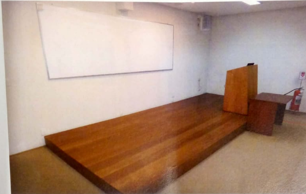
AUDITÓRIO COM CAPACIDADE PARA 60 LUGARES