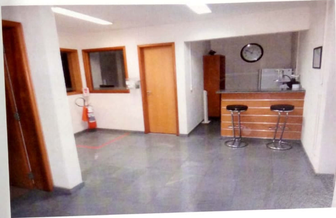
DEPENDÊNCIAS DA EMPRESA