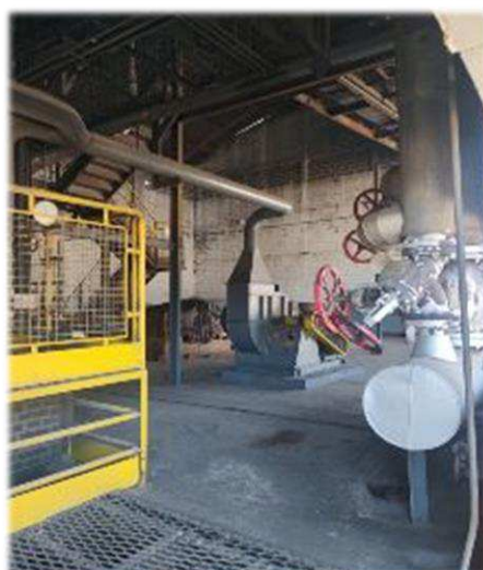
Novo Galpão / Embalagens