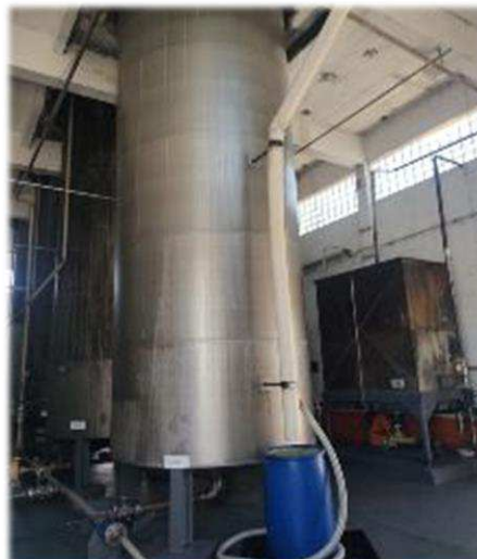
Área das Caldeiras