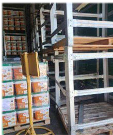
Faturamento / Balança