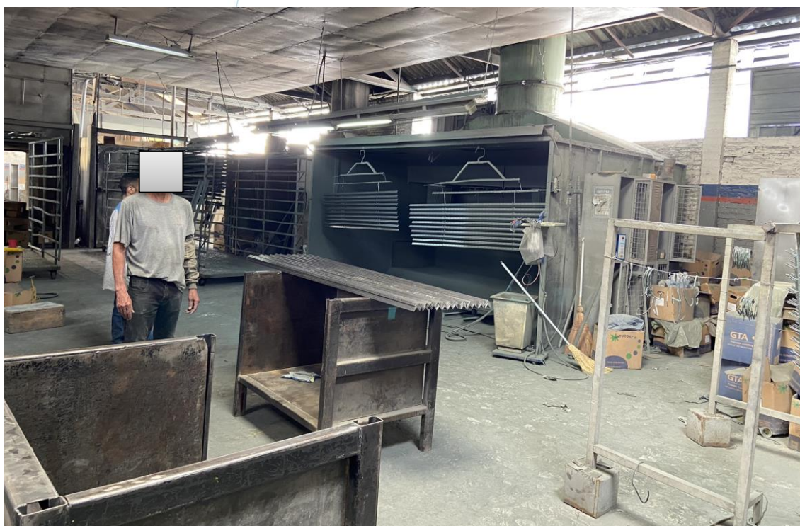
Foto 018: Colaboradores trabalhando no setor de pintura e acabamento