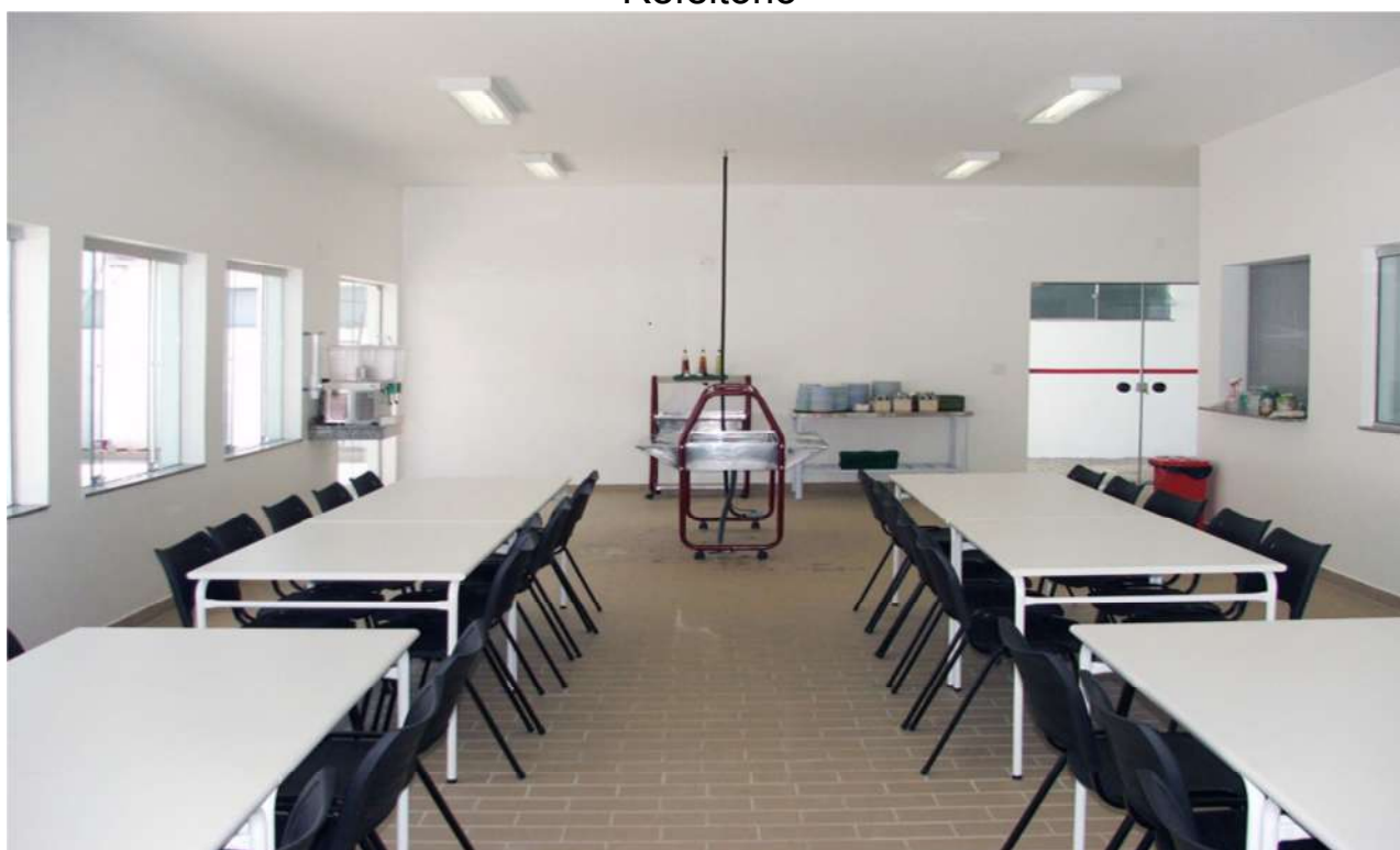
Área de Lazer