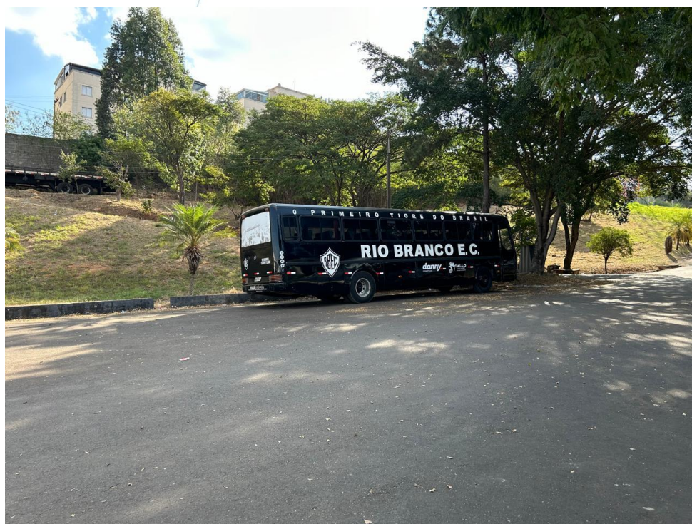
10 – Ônibus do Clube.