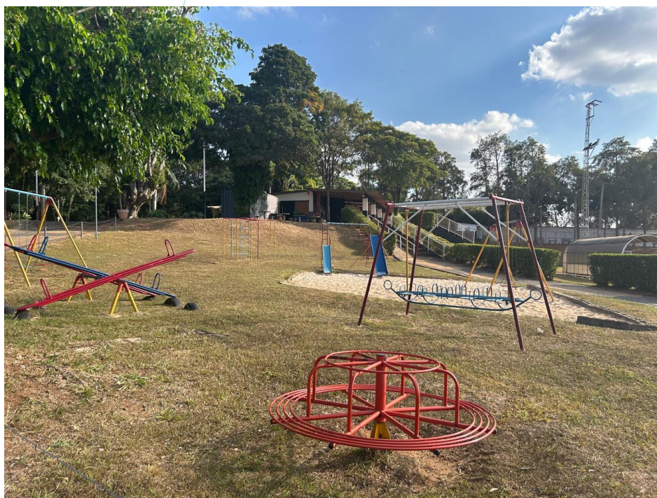
20 – Parquinho infantil