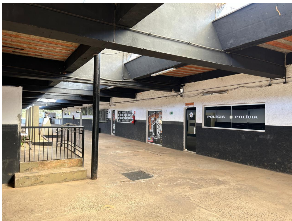
02 – Visão da Area interna do Estádio