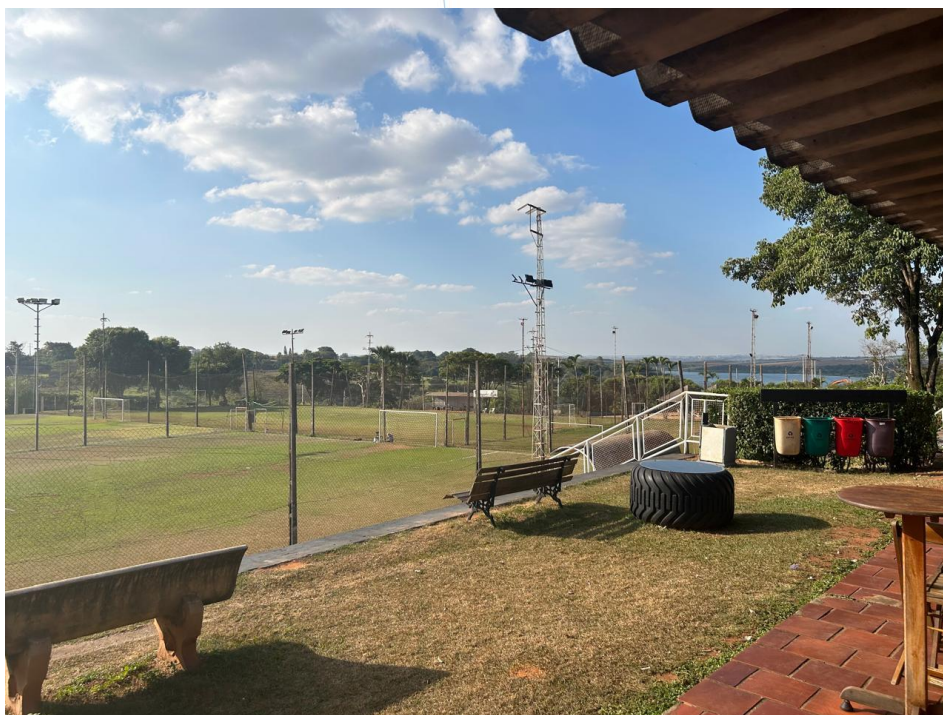
21 – Vista Panorâmica campos de futebol