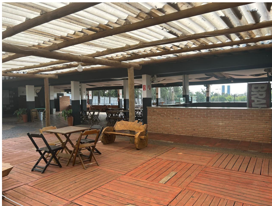
23 – Area Social

Conclusão: Clube em correto funcionamento. Ambiente administrativo, desportivo e social propício à execução da atividade.