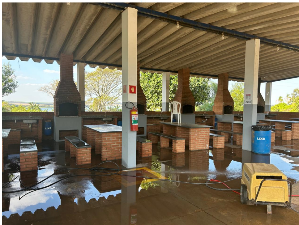
15 – Áreas da Churrasqueira