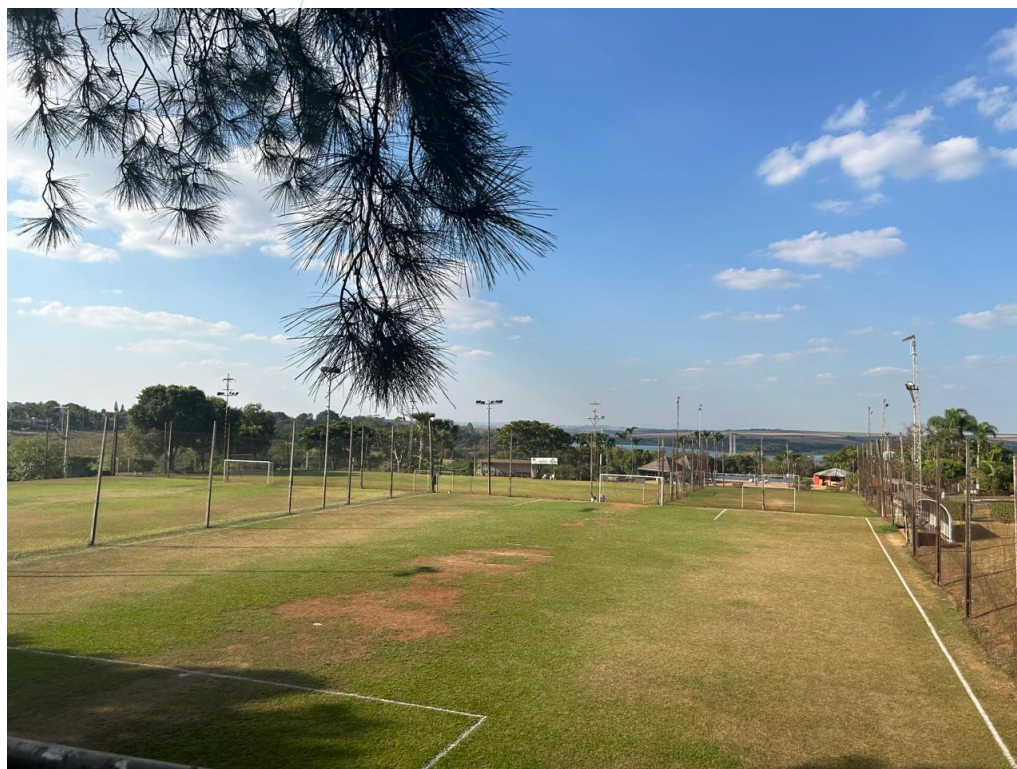
22 – Vista panorâmica campos de futebol