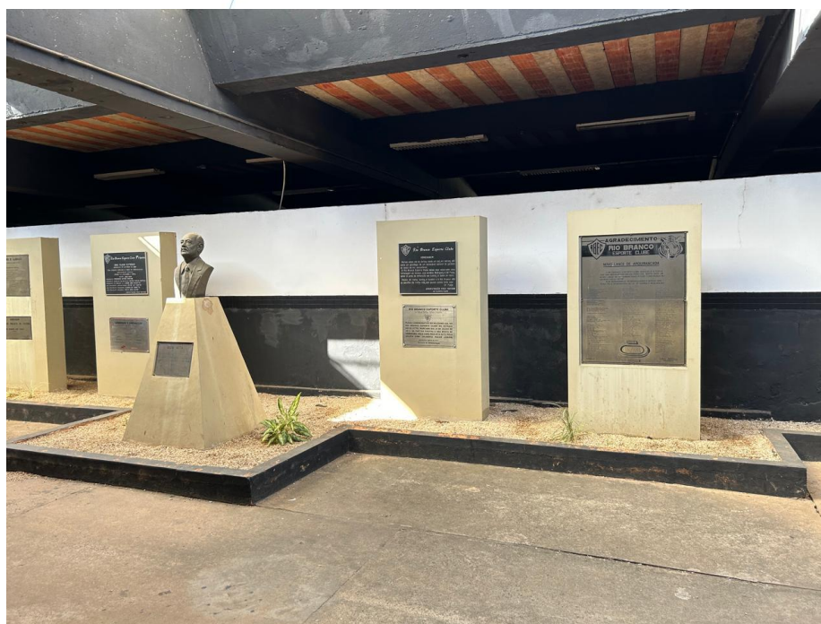
06 – Placas da fundação do Estádio