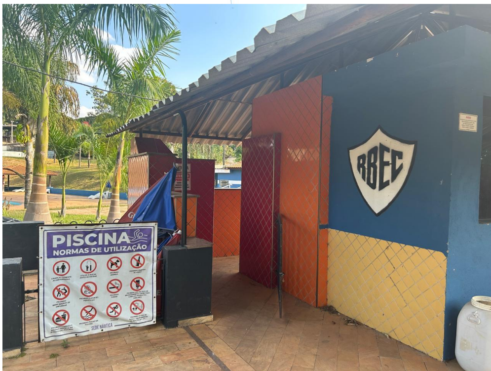
13 – Entrada da piscina