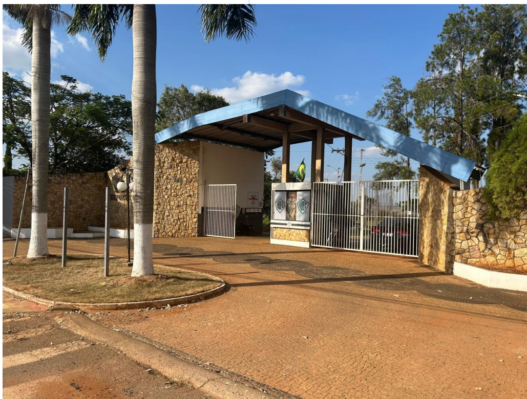
11 – Sede social