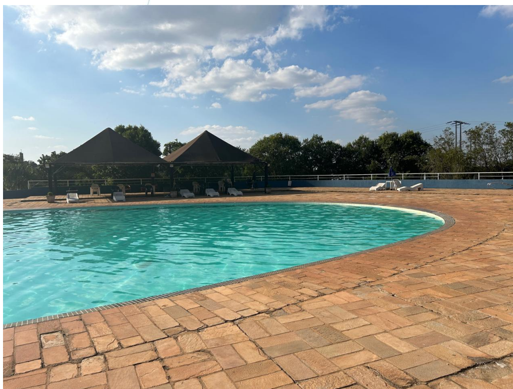
18 - Piscina