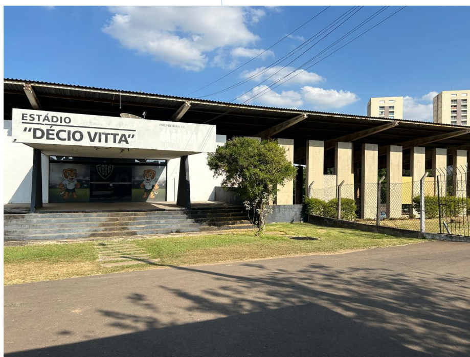
01 – Entrada Estádio