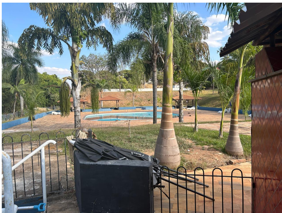
16 - Piscina