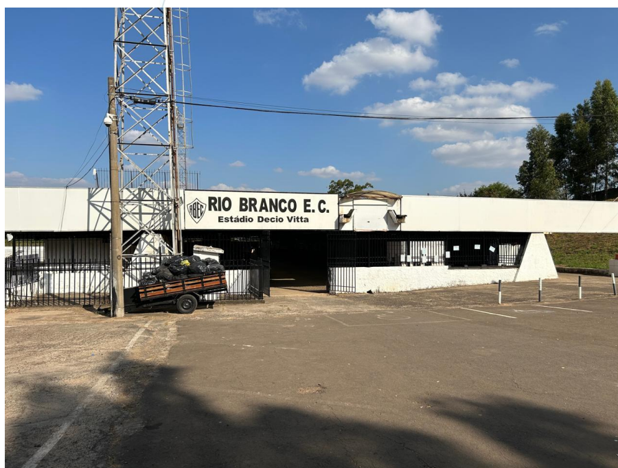
08 – Entrada do Estádio