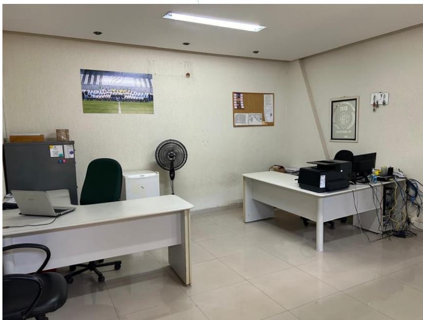
03 - Secretaria