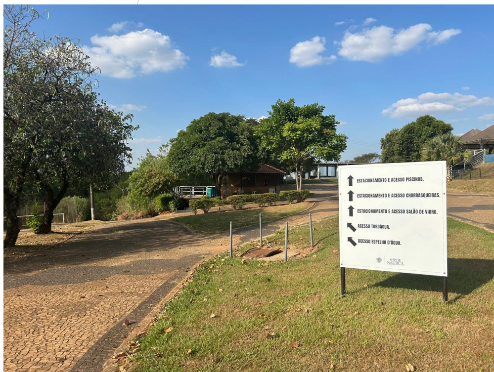
14 – Visão Panorâmica da Sede Social