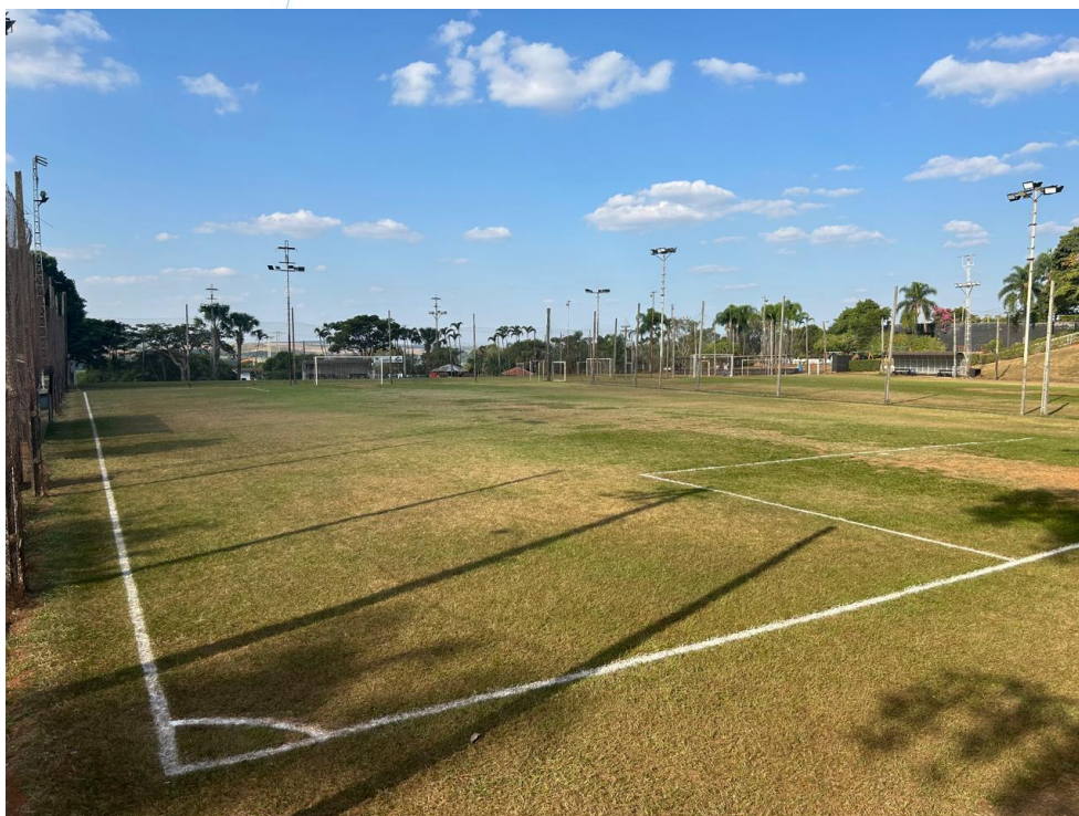
12 – Campos de futebol