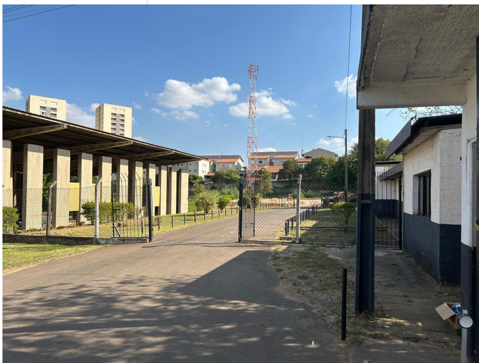
04 – Visão panorâmica da entrada do Estádio