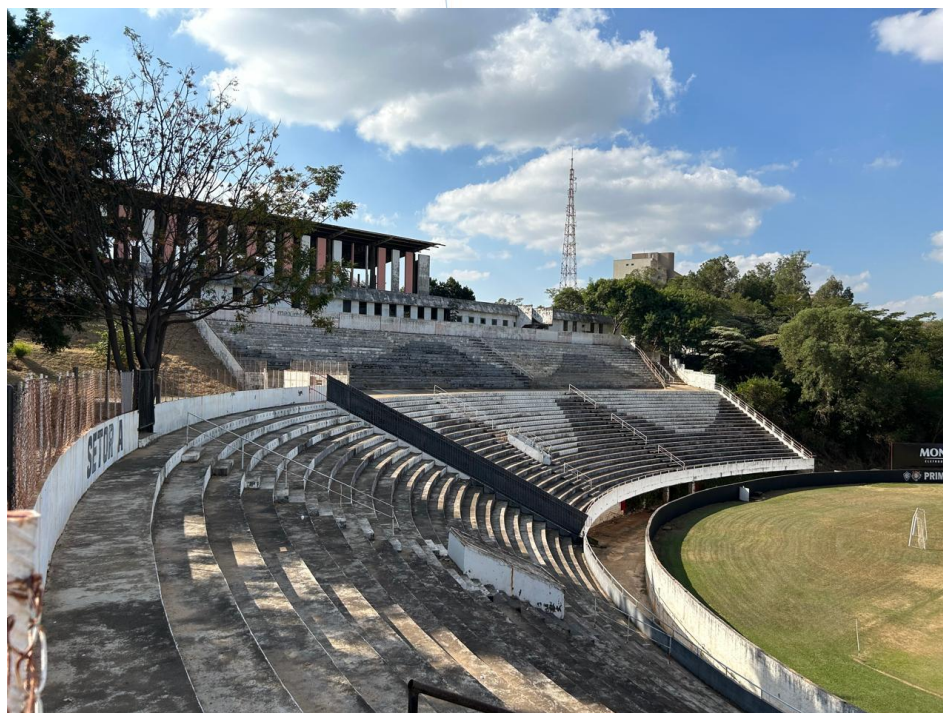
09 – Visão Panorâmica das arquibancadas