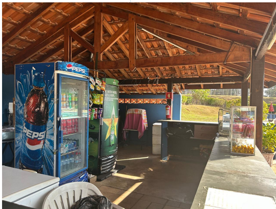
19 – Area Social