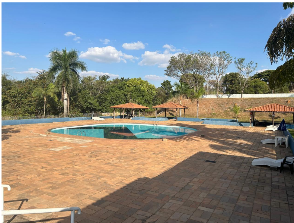
17 - Piscina