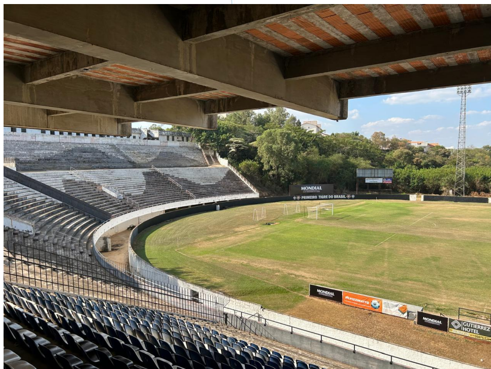
07 – Visão Panorâmica do Estádio