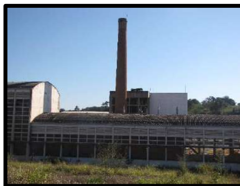
Itapira - SP