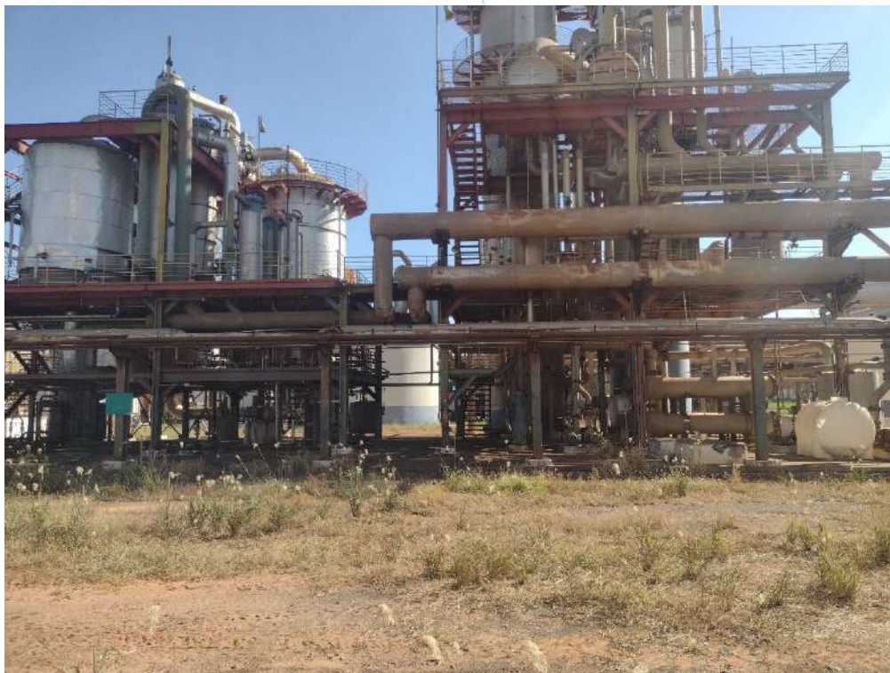
Foto 08 – Resfriadores