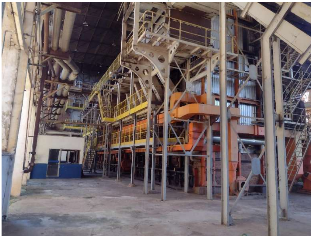
Foto 06 - Destilaria