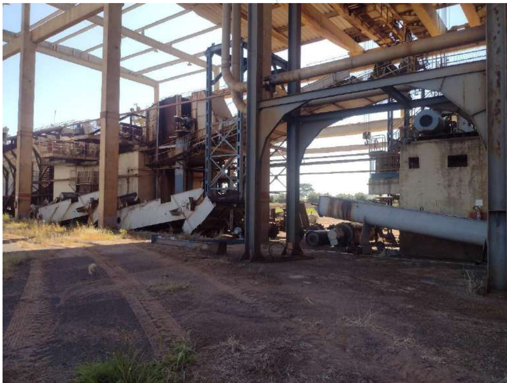
Foto 14 – Área própria ao redor da usina arrendada para o cultivo de soja