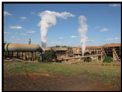
Ariranhas - SP