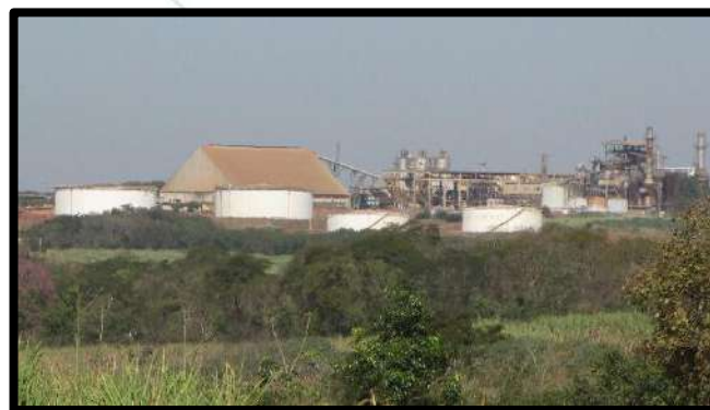
José de Bonifácio - SP