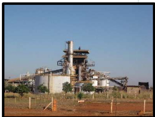
Monções - SP