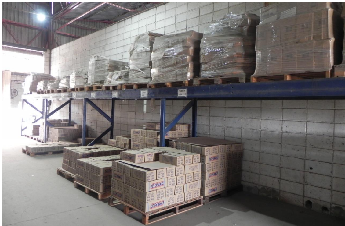
Foto 017: Estoque de produtos finalizados prontos para comercialização