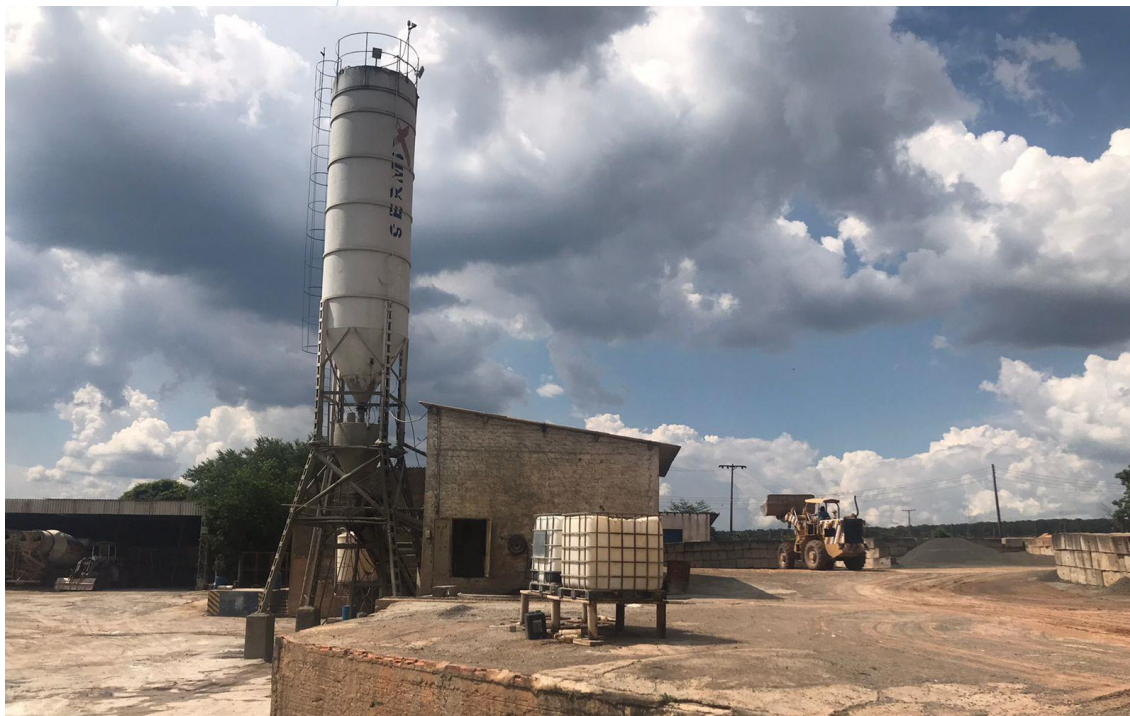
Foto 010: Vista ampla do setor de concretagem e da torre de concreto