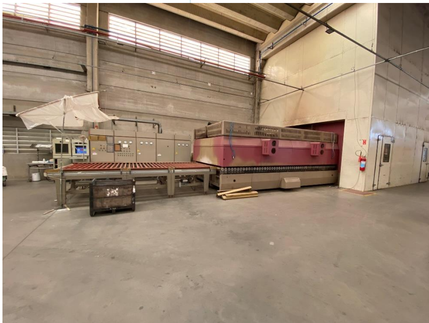
29 - Maquinário