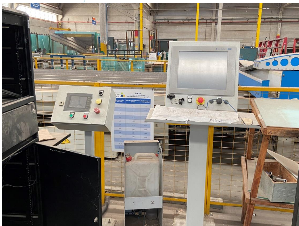
02 – Maquinário