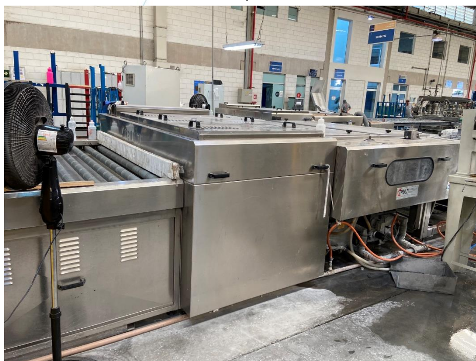
15 - Maquinário