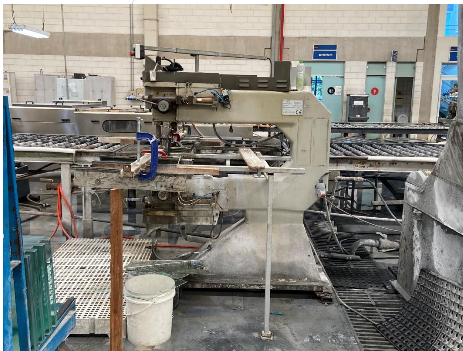
11 - Maquinário