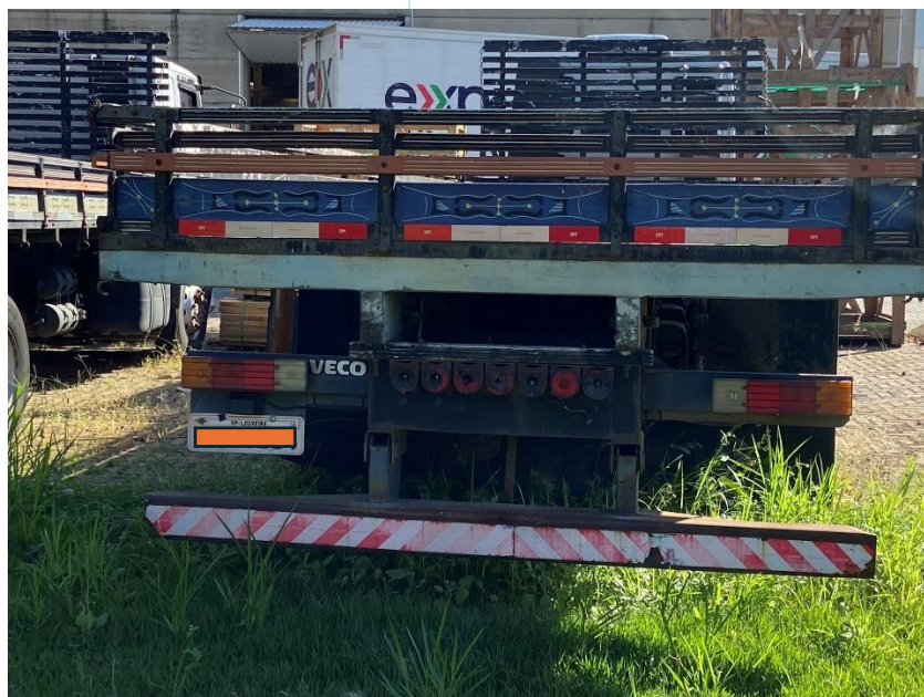
31 - Veículo