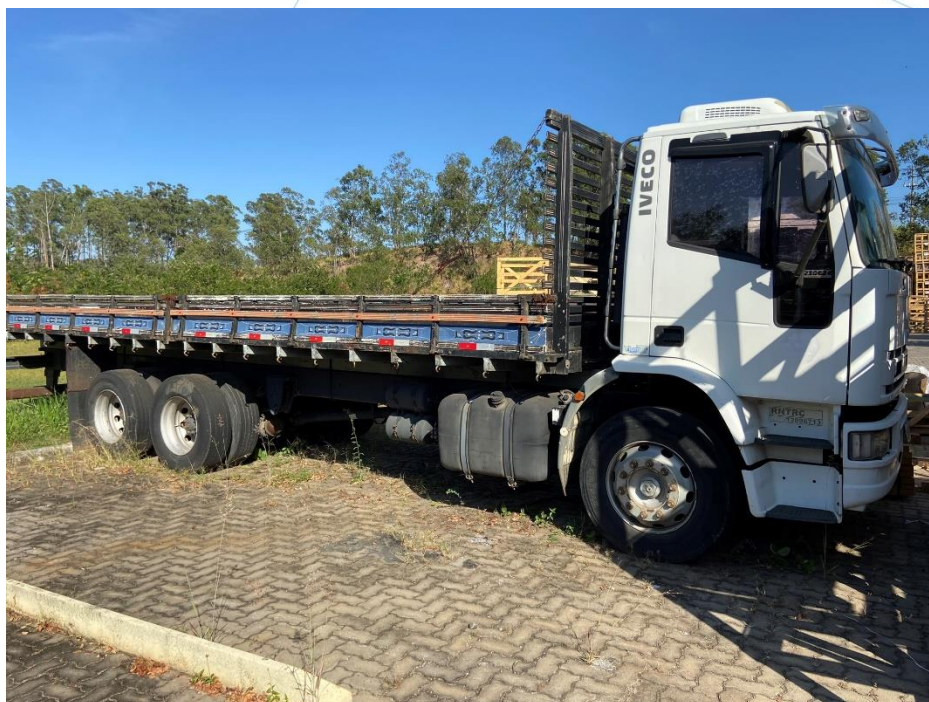
30 - Veículo