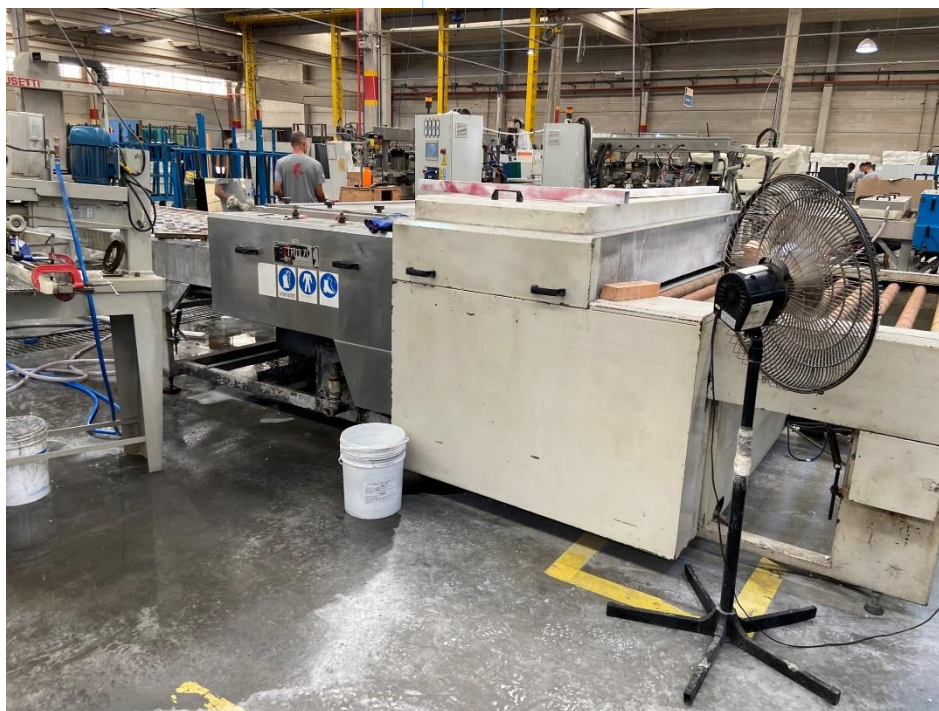
17 - Maquinário