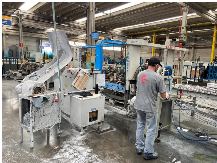
09 – Colaborador em atividade