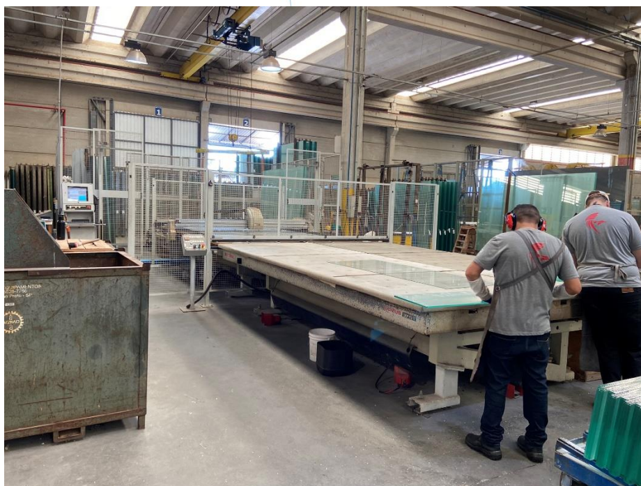
01 – Colaboradores trabalhando