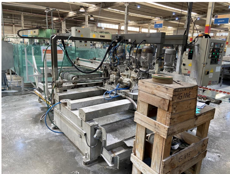
13 - Maquinário