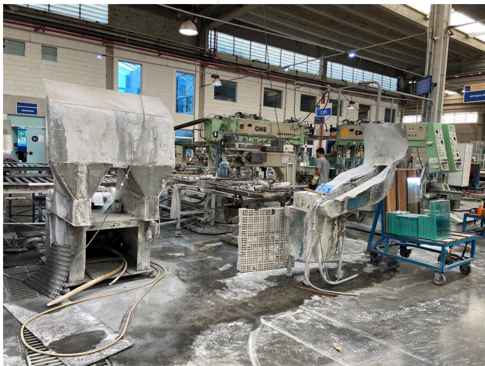
10 - Maquinários