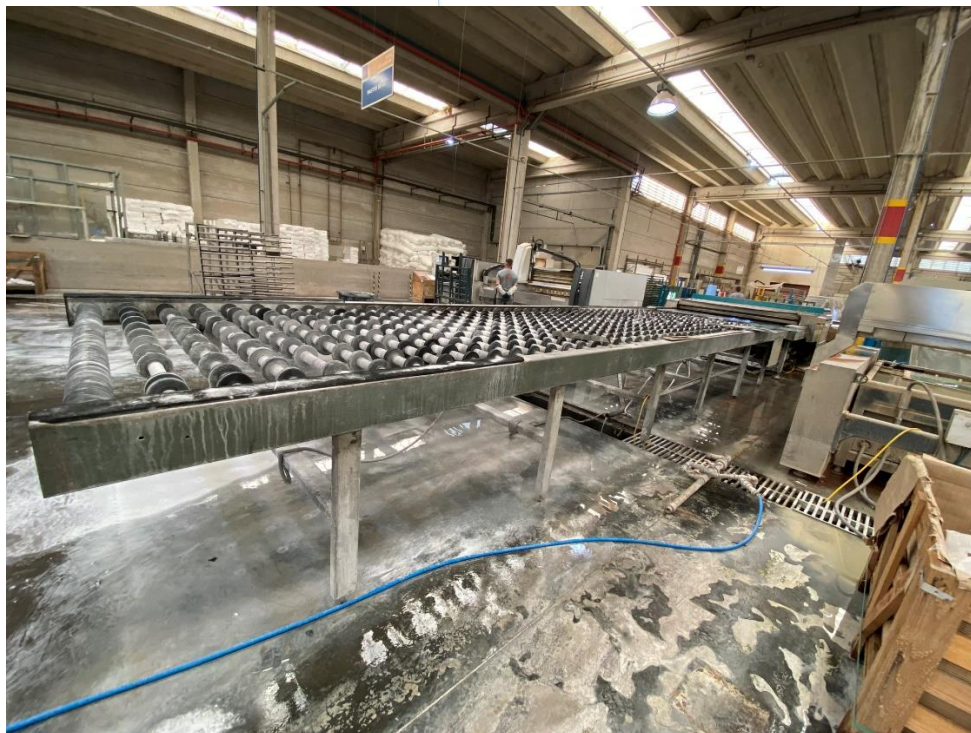
06 - Maquinário