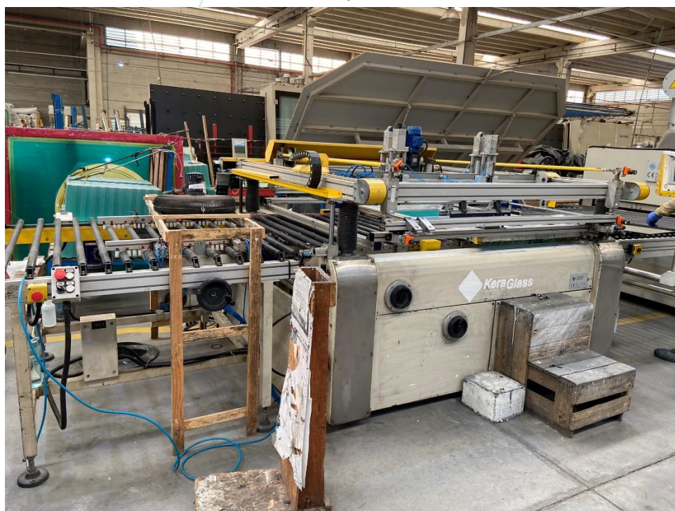
18 - Maquinário