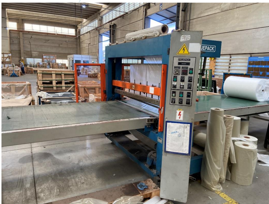
26 - Maquinário