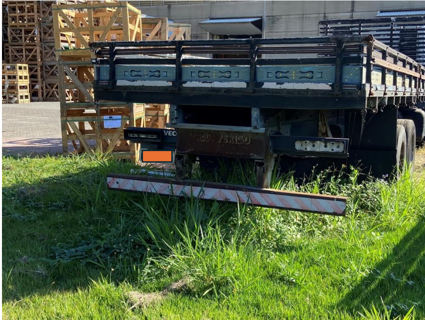
33 - Veículo