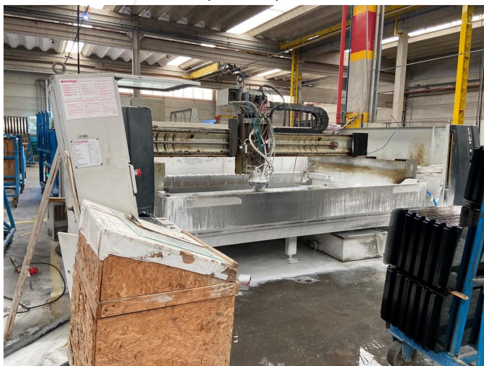
05 - Maquinário