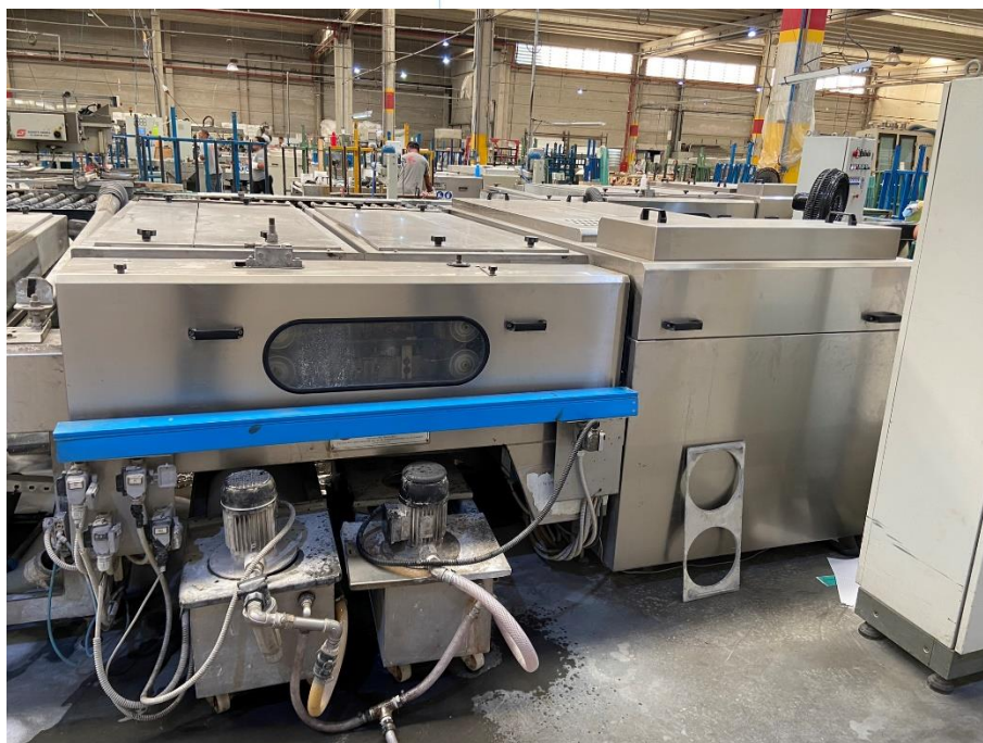
14 - Maquinário