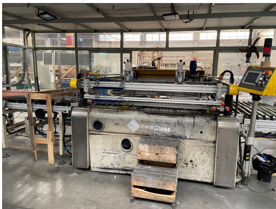
20 - Maquinário