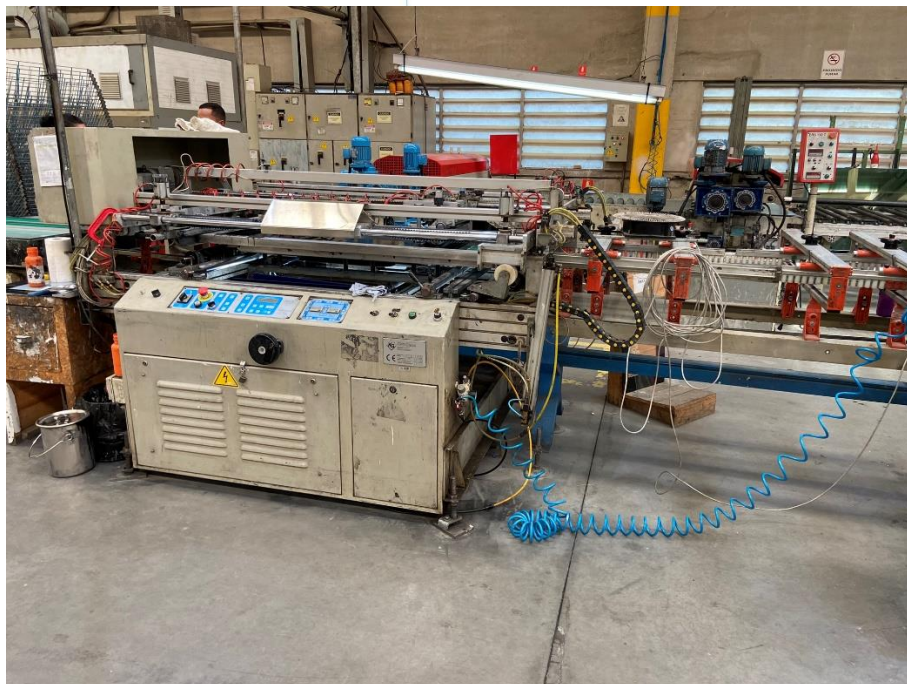
19 - Maquinário