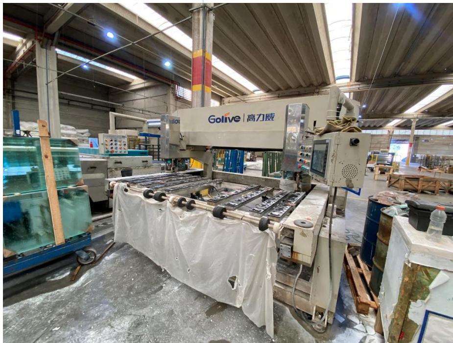
08 - Maquinário