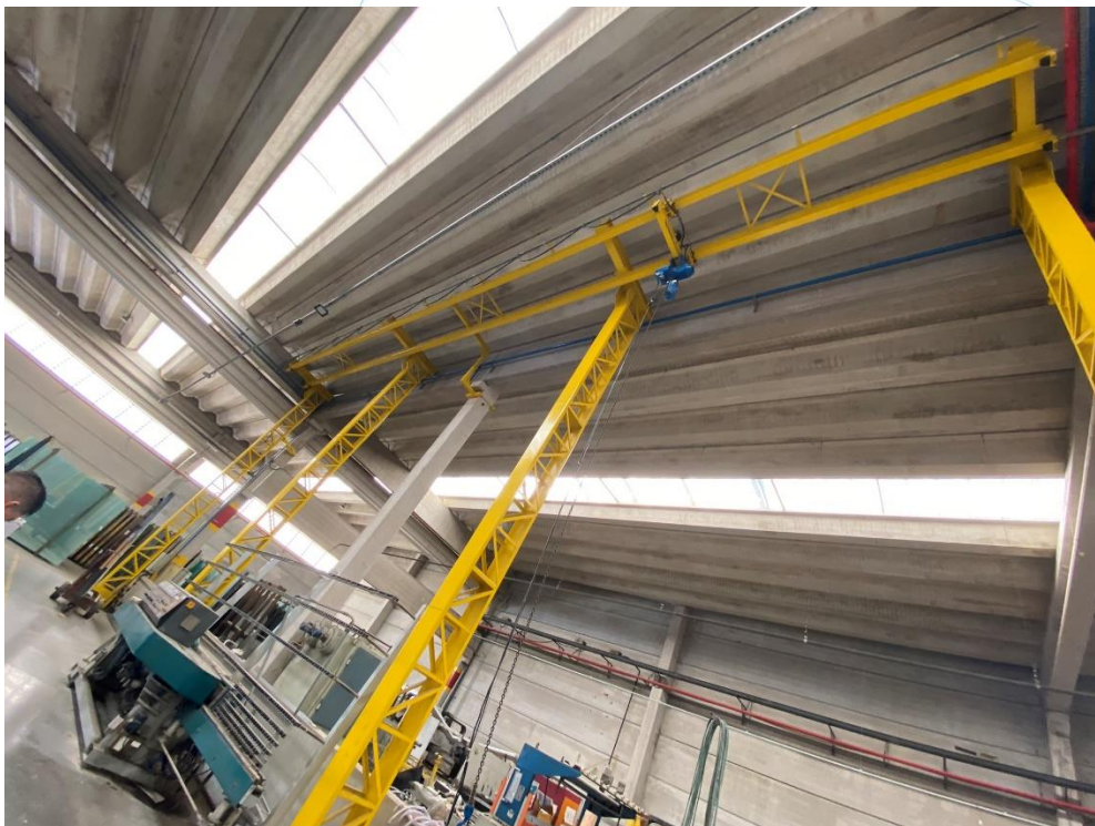
33 - Pontes rolantes