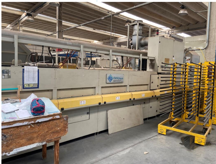
21 - Maquinário