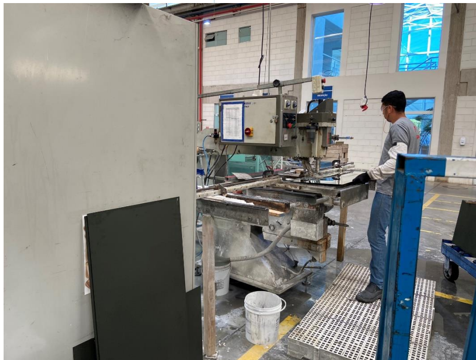
12 – Colaborador operando maquinário