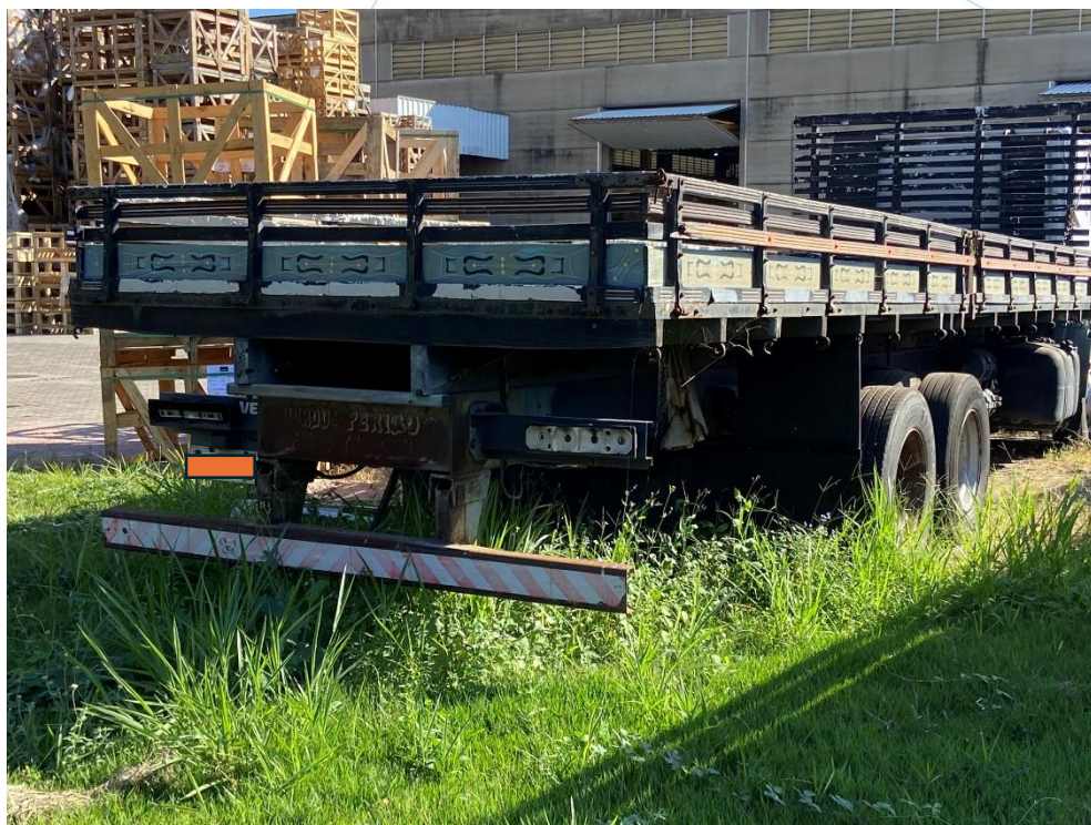
32 - Veículo