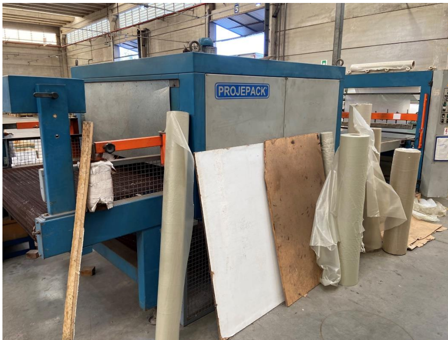
25 - Maquinário