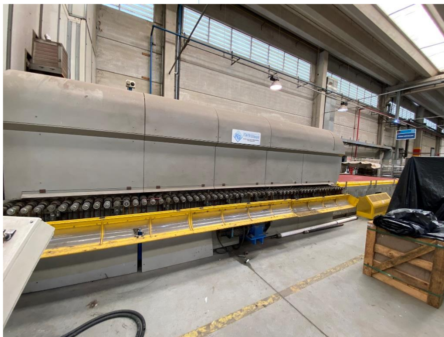
23 - Maquinário