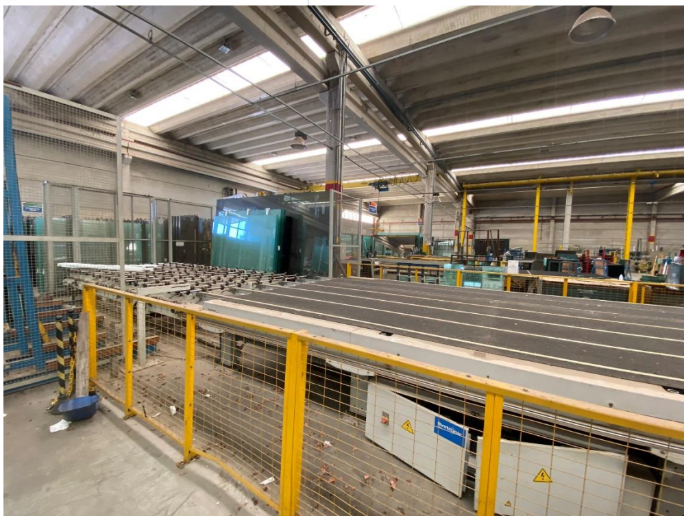
04 -Maquinário e produtos