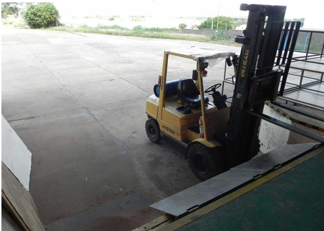
Foto 017: Empilhadeira funcionando normalmente no setor de expedição

Conclusão: A Recuperanda encontra-se em pleno funcionamento, produzindo novos produtos e com colaboradores trabalhando normalmente em todos os setores. Ambiente administrativo limpo e organizado.