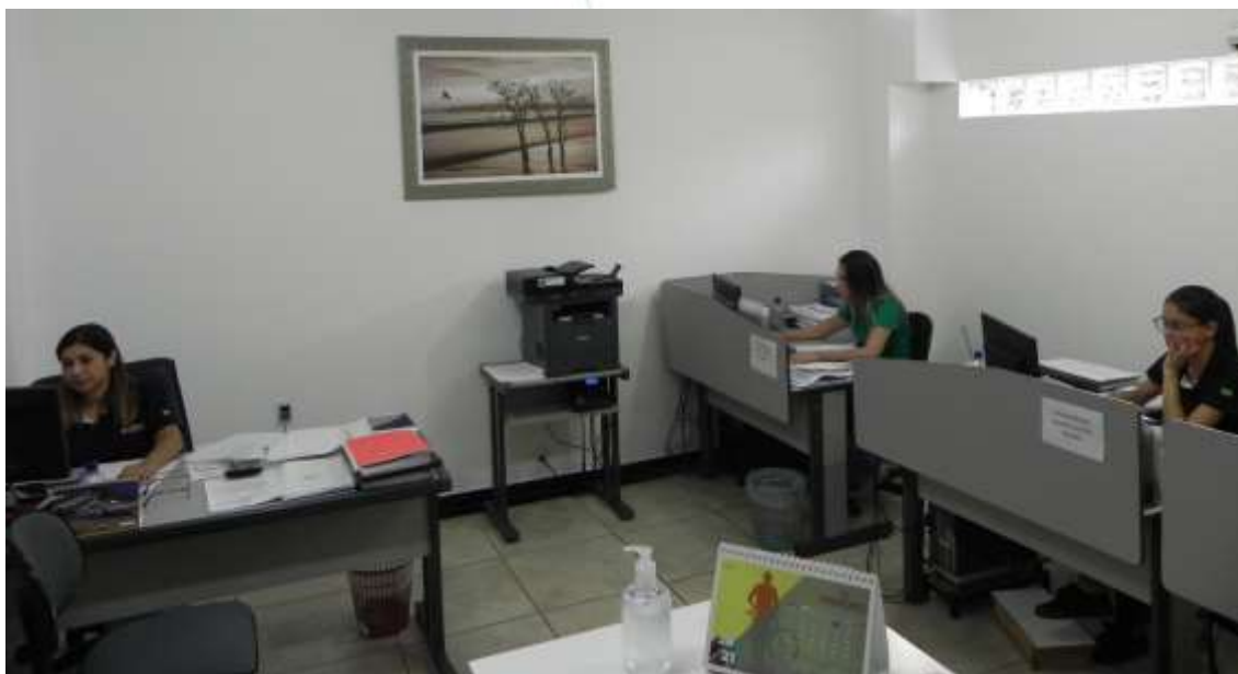
Foto 005: Vista do setor administrativo com colaboradoras trabalhando normalmente