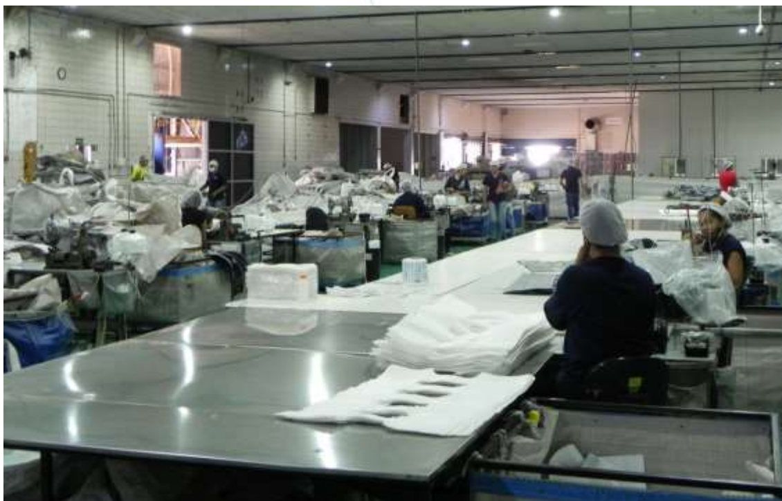
Foto 011: Setor de costura com diversos colaboradores trabalhando