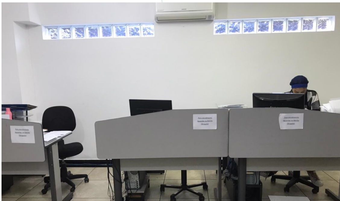
Foto 003: Vista do setor administrativo com colaboradoras trabalhando normalmente