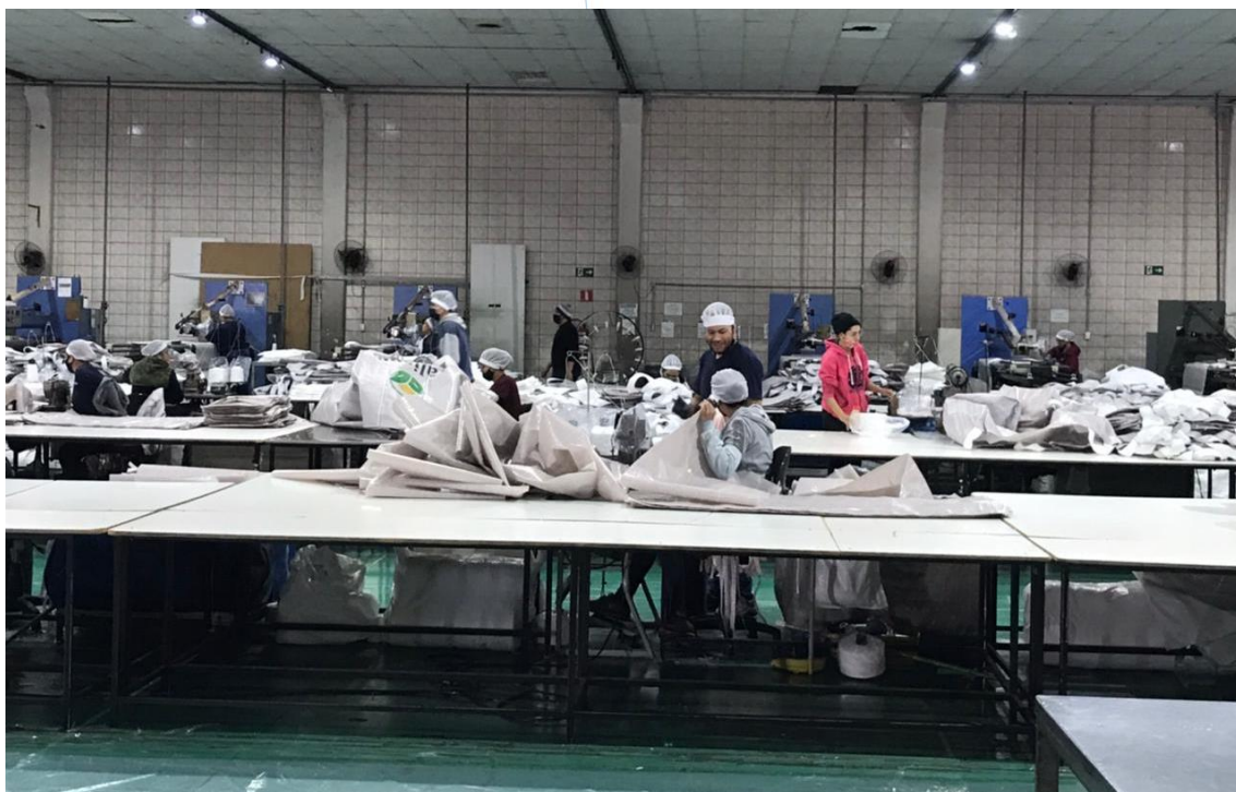
Foto 009: Setor de costura com diversos colaboradores trabalhando