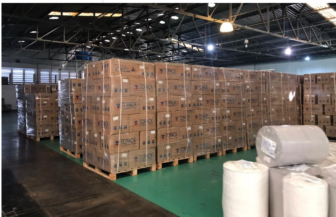
Foto 016: Produtos prontos e acabados aguardando para serem despachados