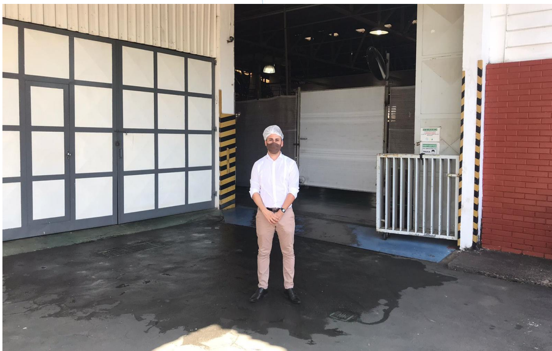
Foto 003: entrada para as dependências administrativa e operacional da empresa