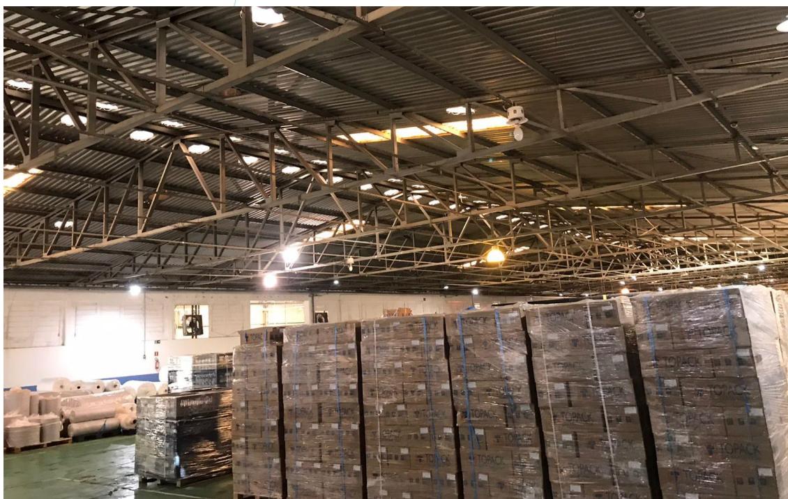
Foto 012: Produtos prontos e acabados aguardando para serem despachados