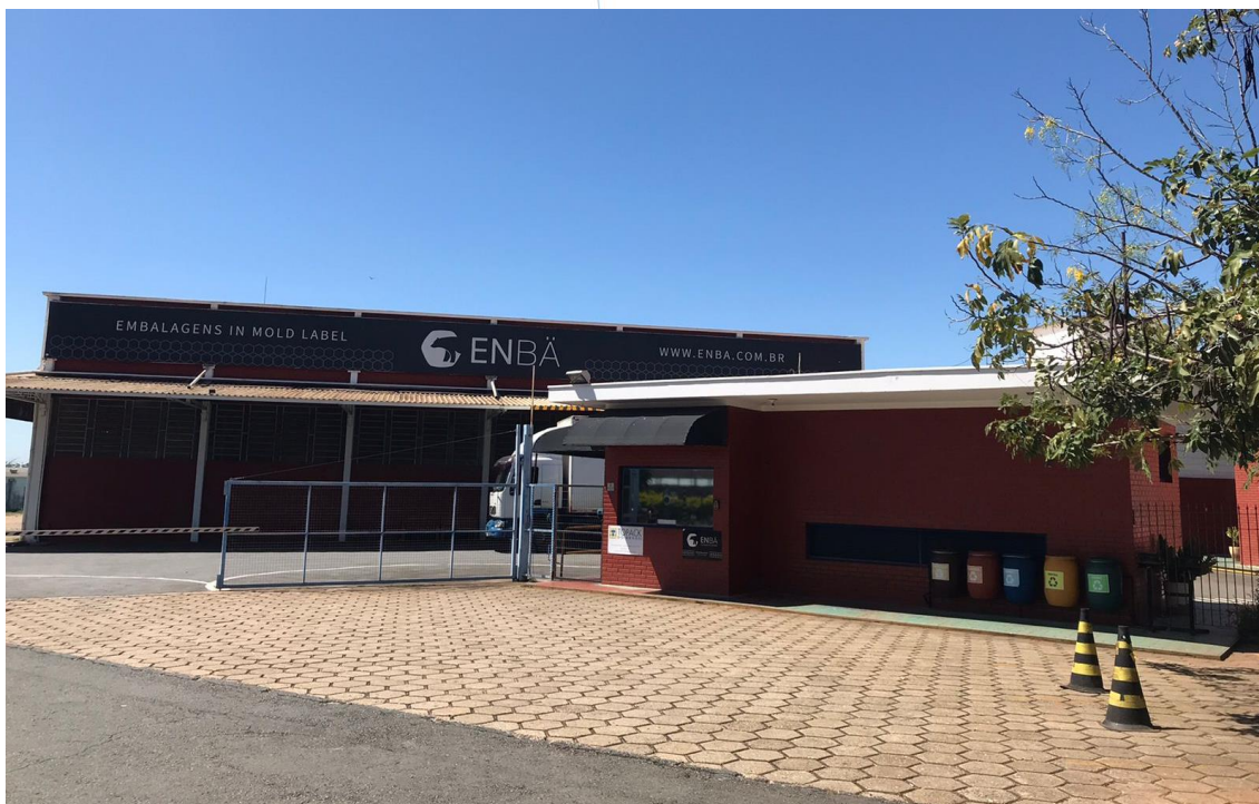
Foto 001: Entrada principal